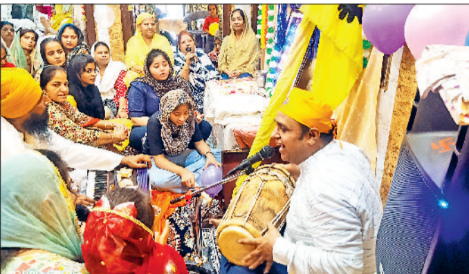
भवानीखेड़ा। गुरु नानकदेव के प्रकाशोत्सव पर शबद कीर्तन करते श्रद्धालु।