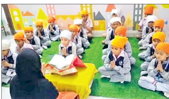
भवानीखेड़ा। ग्रास स्कूल पब्लिक स्कूल में गुरु नानक देव का प्रकाशोत्सव मनाते विद्यार्थी।