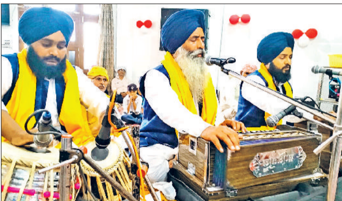
भिवानी। गुरुद्वारा में शबद कीर्तन करता रागी जलथा व लंगर में प्रसाद ग्रहण करते श्रद्धालु।

जिले में गुरु नानक देव के प्रकाशोत्सव पर कई जगह गुरुद्वारों में कार्यक्रम