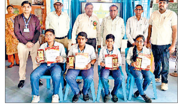
महेंद्रगढ़। विजेता विद्यार्थियों को सम्मानित करते हुए।