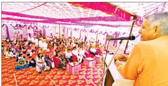
भिवानी। एनएसएस शिविर को संबोधित करते सांसद धर्मबीर सिंह।

लोहारू। शहर के लोहारू-भिवानी रोड पर बहुतकनीकी कॉलेज के सामने एक होटल पर खाना खाने पहुंचे युवक की खाना खाने के बाद हालत बिगड़ गई। उसे आनन-फानन में होटल मालिक ने स्थानीय सामुदायिक स्वास्थ्य केंद्र पहुंचाया, जहां उपचार के दौरान युवक की मौत हो गई। मृतक युवक की पहचान नहीं हो पाई है। घटना की सूचना पर लोहारू थाना पुलिस टीम मौके पर पहुंचकर मामले की जांच में जुट गई। पुलिस ने मृतक युवक की पहचान कराने में आम लोगों से मदद की अपील की है। बहरहाल मृतक युवक के शव को स्थानीय अस्पताल के शव गृह में रखा गया है। बताया जाता है कि करीब 35 वर्षीय युवक अकसर होटल पर खाना खाने के लिए आता था।