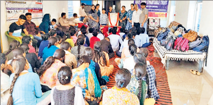
भिवानी। गुरु नानक देव को नमन करते दिव्यांग विद्यार्थी व शिक्षक।