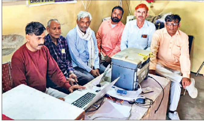
नारनौल। मेरी फसल मेरा ब्योरा पोर्टल पर प्रॉटी करने पहुंचे किसान।

सरकार ने खाद की उचित मूल्य पर उपलब्धता सुनिश्चित करने के लिए भी फसल पंजीकरण को अनिवार्य कर दिया है। इसका सीधा अर्थ है कि यदि किसान का पंजीकरण सही नहीं हुआ तो उसे खाद खरीदने में भी दिक्कत आ सकती है। जिले की बात करें तो कृषि योग्य भूमि का कुल रकबा लगभग 3.72 लाख एकड़ है। जिस पर सरसों, गेहूँ और अन्य फसलों की बिजाई होती है। नांगल चौधरी और निजामपुर जैसे क्षेत्रों में सिंचाई के लिए पर्याप्त नहरी पानी की कमी के कारण अक्सर किसान पूरे रकबे पर बिजाई नहीं कर पाते हैं। ऐसे में जब वे अधूरे या खंडित रकबे का विकल्प दर्ज करते हैं और उसे सुधारने का विकल्प नहीं मिलता तो उनकी समस्या कई गुना बढ़ जाती है। जिले में अब तक 25605 किसानों ने 87459.71 एकड़ रकबे पर पंजीकरण करवाया है। यह दिखाता है कि किसान सरकारी प्रक्रिया में गमले रहे हैं, लेकिन तकनीकी अड़चनें उन्हें निराश कर रही हैं।