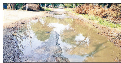
कनीना। नारनौल मार्ग पर नांगल गांव के पास जमा गंदा पानी।

कनीना। उप मंडल को जिला मुख्यालय नारनौल से जोड़ने वाला मुख्य रोड की हालत अत्यंत दयनीय हो चुकी है। जिसके चलते जिला मुख्यालय पर पहुंचने के लिए छोटे मार्ग के बजाय लोगों को नेशनल हाईवे 152 डी पर प्रॉटी कर टोल टैक्स देकर जाना पड़ता है, जो दोपहिया वाहन चालकों के लिए नहीं है। कनीना नारनौल मार्ग क्षतिग्रस्त होने से दो दर्जन से अधिक गांव के ग्रामीणों को भारी परेशानी का सामना करना पड़ता है और जिला मुख्यालय पहुंचना दुष्पर हो रहा है। इस मार्ग में अनेक जगह गहरे गड्ढे बने हुए हैं। वहीं गांव नांगल के पास मुख्य सड़क पर घरों को गंदा पानी जमा रहता है, जिससे सड़क पर गहरे गड्ढे बन गए हैं।