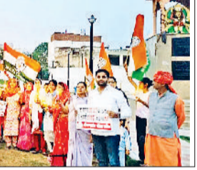
महेंद्रगढ़। कार्यक्रमें में उपस्थित विद्यार्थी व स्टाफ सदस्य।

आरती सिंह राव आभार व्यक्त किया। बाबा खेतानाथ आयुर्वेदिक कॉलेज पटीकरा में बीएएमएस सीटों की संख्या शैक्षणिक सत्र 2025-26 में 100 की मंजूरी दिलाने पर केंद्रीय मंत्री राव इंद्रजीत सिंह एवं स्वास्थ्य मंत्री आरती सिंह राव का आभार जताते हुए खुशी व्यक्त की है। आयुर्वेदिक मेडिकल कॉलेज में सीटें बढ़ाने से महेंद्रगढ़ जिले और आसपास के क्षेत्रों के विद्यार्थियों को लाभ होगा। अब जिले के विद्यार्थियों को आयुर्वेदिक शिक्षा के लिए अन्य राज्यों या दूरदराज के संस्थानों में नहीं जाना पड़ेगा। आरती राव ने केवल अटेली क्षेत्र बल्कि पूरे दक्षिण हरियाणा में चिकित्सा, शिक्षा और आधारभूत विकास को लेकर अभूतपूर्व कार्य कर रही हैं। आयुर्वेदिक शिक्षा और चिकित्सा संस्थानों के विस्तार के लिए लगातार प्रयासरत।