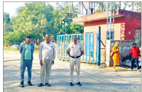
महेंद्रगढ़। बस स्टैंड के मुख्यद्वार पर तैनात रोडवेज के कर्मचारी व पुलिसकर्मी।

सड़क जाम, आमजन को उठानी पड़ती है परेशानी हरिभूमि न्यूज़ ▶▶ महेंद्रगढ़